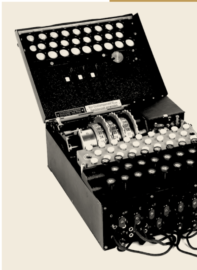
Màquina Enigma del Museu Nacional de la Ciència i la Tecnologia Leonardo da Vinci, Milà.