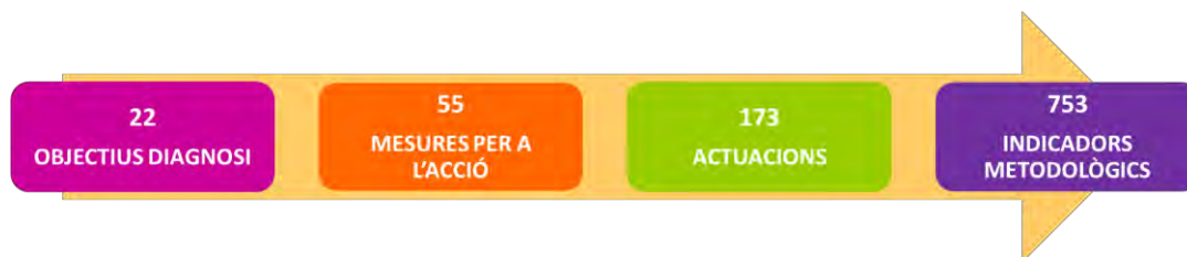
Figura 2: quantificació dels resultats obtinguts del procés participatiu

D'altra banda, senyalar que aquests espais participatius de diagnosi i propostes que han servit per identificar objectius de diagnosi, mesures per a l'acció, actuacions concretes i indicadors metodològics s'han sistematitzat, ordenat i agrupat al voltant dels cinc grans àmbits temàtics sorgits de la diagnosi participada , i a més amb la intencionalitat de promoure cert paral·lelisme amb els àmbits temàtics estructuradors del Pla d'Acció del Pla Local de Joventut recentment aprovat. Partint de la premissa compartida que tot allò impulsat en el marc del Pla d'Infància i Adolescència ha de tenir un efecte estratègic de perfil preventiu (quan no reactiu i assistencial, cada cop que esdevingui necessari, òbviament) que comprometi als i les gestores responsables de dit Pla ha estar amatents amb la promoció de les oportunes sinèrgies d'acció entre plans, recursos, programes, serveis..., tot vigilant perquè l'aplicació progressiva d'aquestes mesures vagin tenint el seu impacte gradual i seqüencial en l'evolució de la persona infant i adolescent cap l'etapa de la seva joventut, tot buscant revertir les desigualtats socials i els factors d'exclusió social futurs .