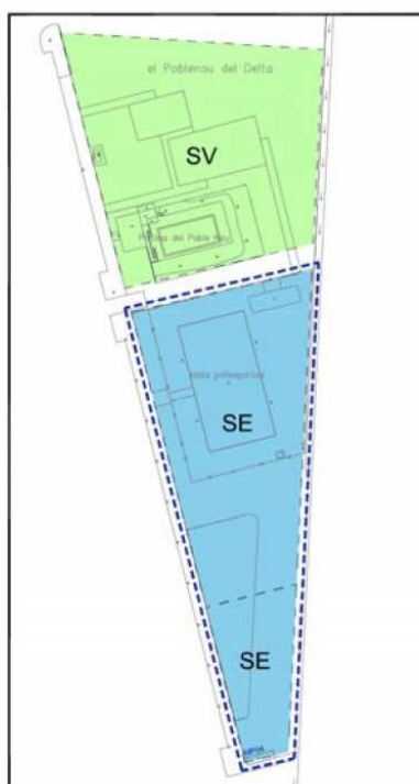
tr modificació puntual del poum 004